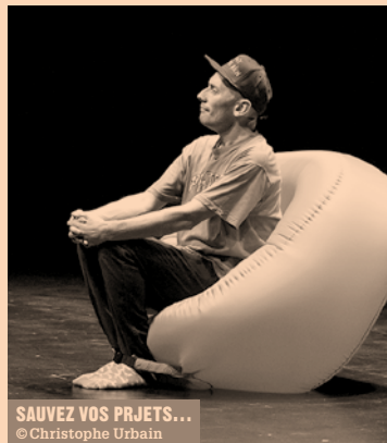
SAUVEZ VOS PROJETS...