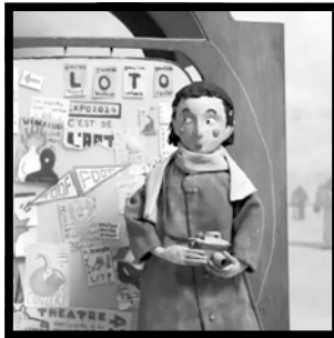
ALWAYS WANTED TO BE GOD, ...