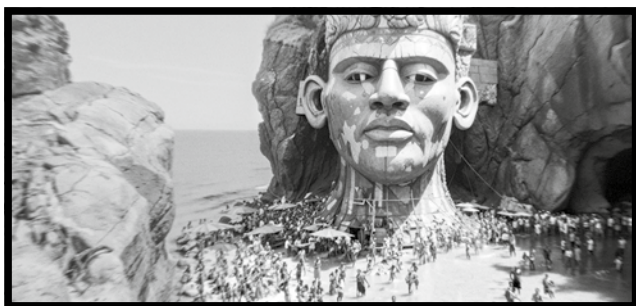
MEMORY OF PRINCESS MUMBI