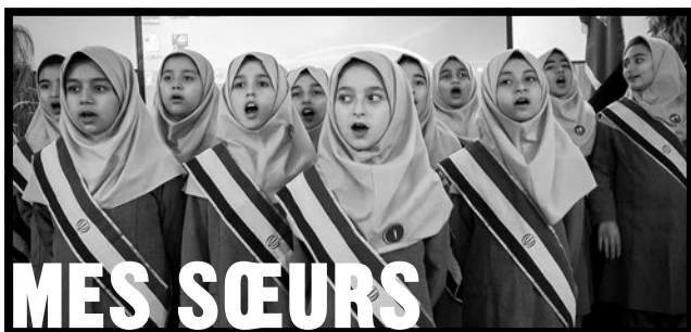
TABLE et YALDA, Massoud Bakhshi revient au documentaire avec ce film qui s'inscrit dans la lignée d'un cinéma iranien élaboré à hauteur d'enfant, et tire sa force et sa générosité d'une relation qui s'est construite sur le temps long. Inspiré d'une histoire locale, TOUTES MES SŒURS est une œuvre universelle de résistance et de révolte.