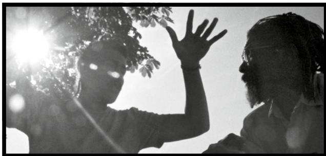
I LOVE YOU, I LEAVE YOU