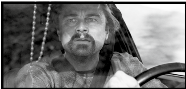
UNE BATAILLE APRÈS L'AUTRE

Ancien révolutionnaire désabusé et paranoïaque, Bob (Leonardo DiCaprio) vit en marge de la société, avec sa fille Willa (Chase Infiniti), indépendante et pleine de ressources. Quand son ennemi juré (Sean Penn) refait surface après 16 ans et que Willa disparaît, Bob remue ciel et terre pour la retrouver, affrontant pour la première fois les conséquences de son passé... film controversé, spectacle cinématographique de génie pour les un-es et chronique simpliste des réalités sociales et politiques pour les autres, il a le mérite de susciter le débat dans un monde où celui-ci tend à s'esouffler. Oscar du meilleur film.