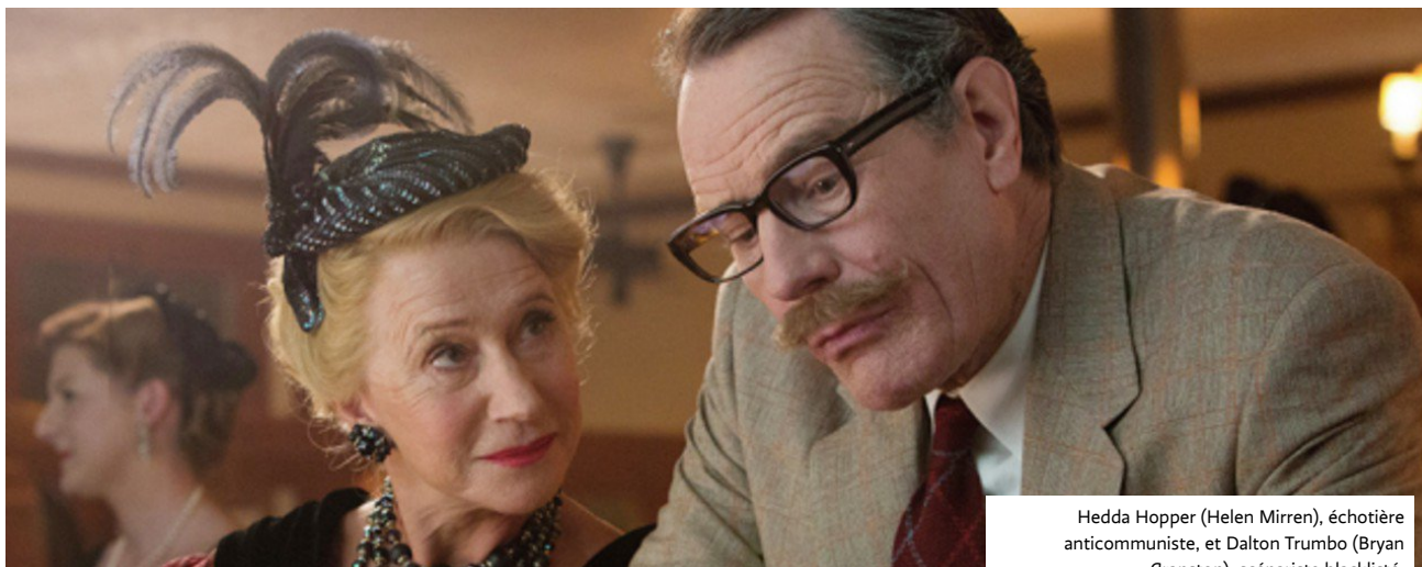
Hedda Hopper (Helen Mirren), échoitière anticommuniste, et Dalton Trumbo (Bryan Cranston), scénariste blacklisté.